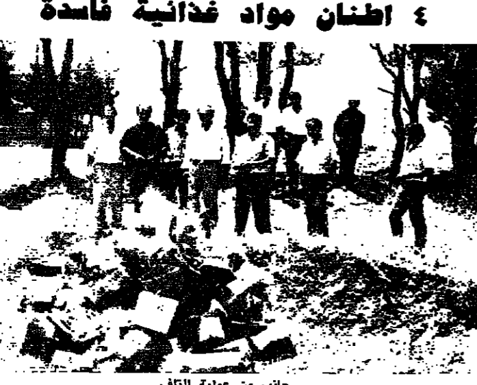
جانب من عملية التفت